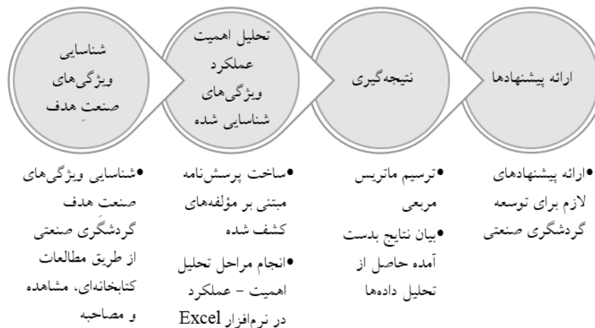
شکل ۱: فرایند پژوهش

ابتدا تعداد ۲۰ پرسش‌نامه توزیع شد و در نهایت ۱۶ پرسش‌نامه با داده‌های کامل مورد تحلیل قرار گرفت. اطلاعات این خبرگان در جدول شماره (۳) آمده است.