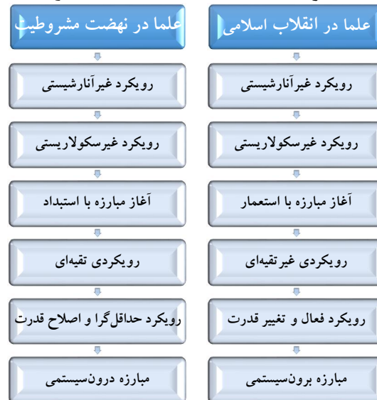
شکل شماره (۲): مقایسه الگوی مقاومت علمای شیعه در دو دوره مشروطیت و انقلاب اسلامی