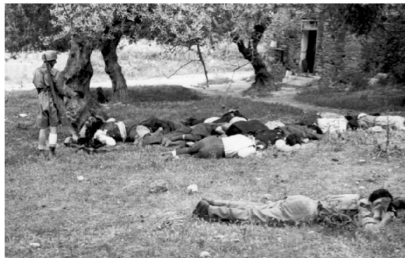
تصویر شماره ۱: قتل غیرنظامیان یونانی در کوندماری، کرت توسط چتربازان آلمانی ۱۹۴۱م

ب. همچنین جنایات هولناک آلمان نازی در جریان جنگ جهانی دوم امری هویدا بوده و هنوز برخی اثرات آن گریبانگیر جامعه بین‌المللی است. ۴ اردوگاه‌های کار اجباری، کشتار اسرای روسی و لهستانی و... تنها گوشه‌ای از جنایاتی است که آلمان در فاصله‌ای نه‌چندان دور در کارنامه دارد. ۵